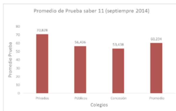
Figura 3. Promedio Pruebas Saber 2011.